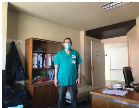
Sede de CESM CLM Hospital G.U. Guadalajara