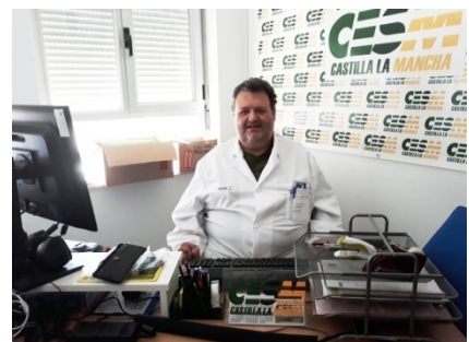
DESPACHO SEDE HOSPITAL