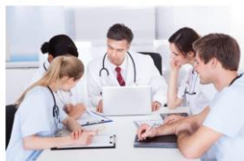
Consultat con vuestro Delegado de CESH CLM

Podrán solicitarlos aquellos que no hagan guardias de presencia física